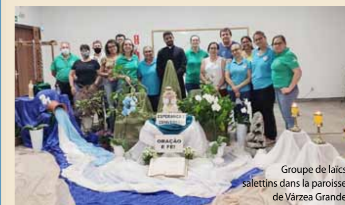
Groupe de laïcs salettins dans la paroisse de Varzea Grande

Coordinatrice nationale des laïcs salettins au Brésil