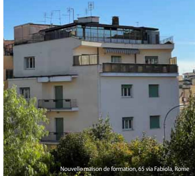
Nouvelle maison de formation, 65 via Fabiola, Rome