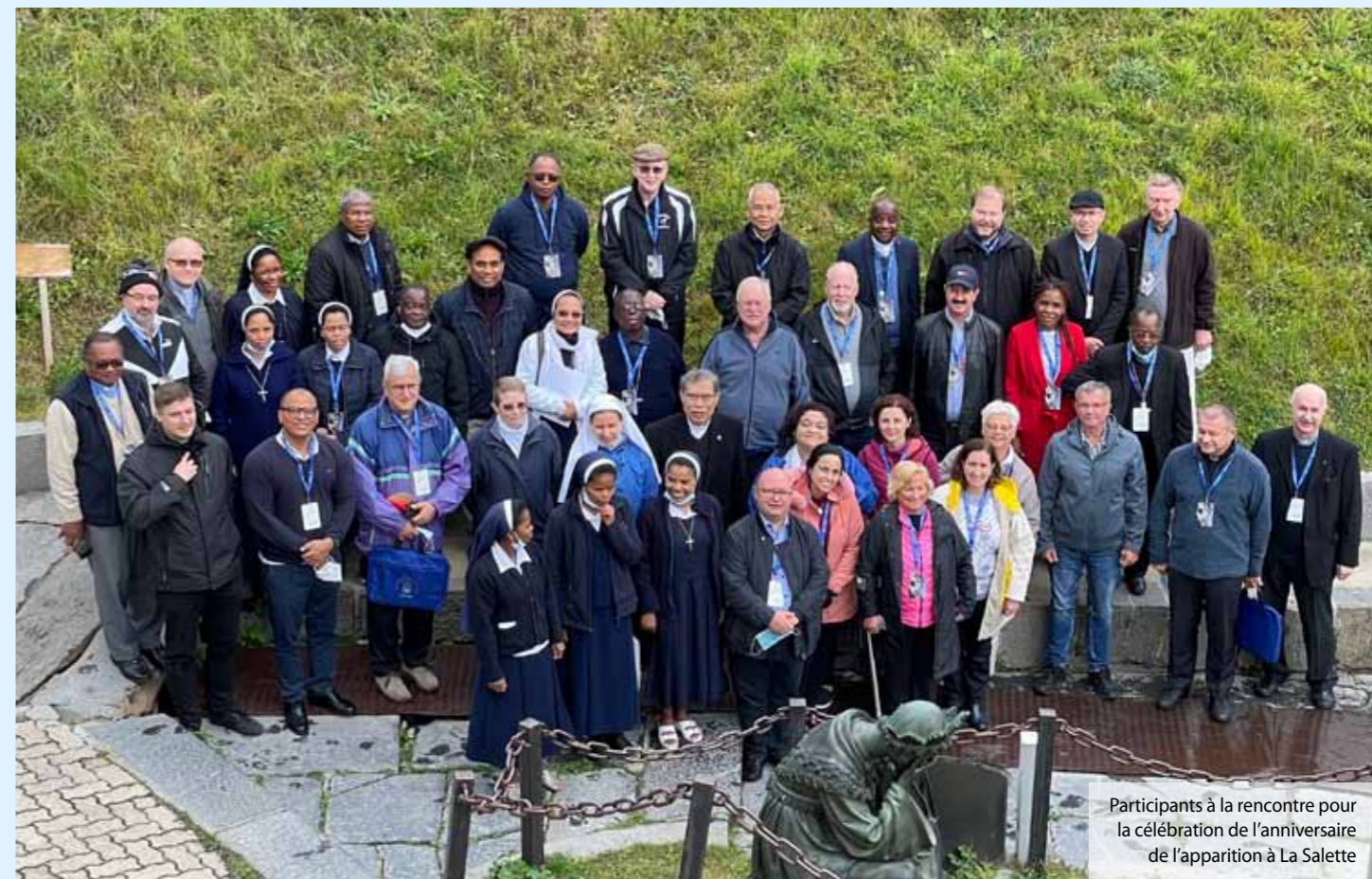
Participants à la rencontre pour la célébration de l'anniversaire de l'apparition à La Salette