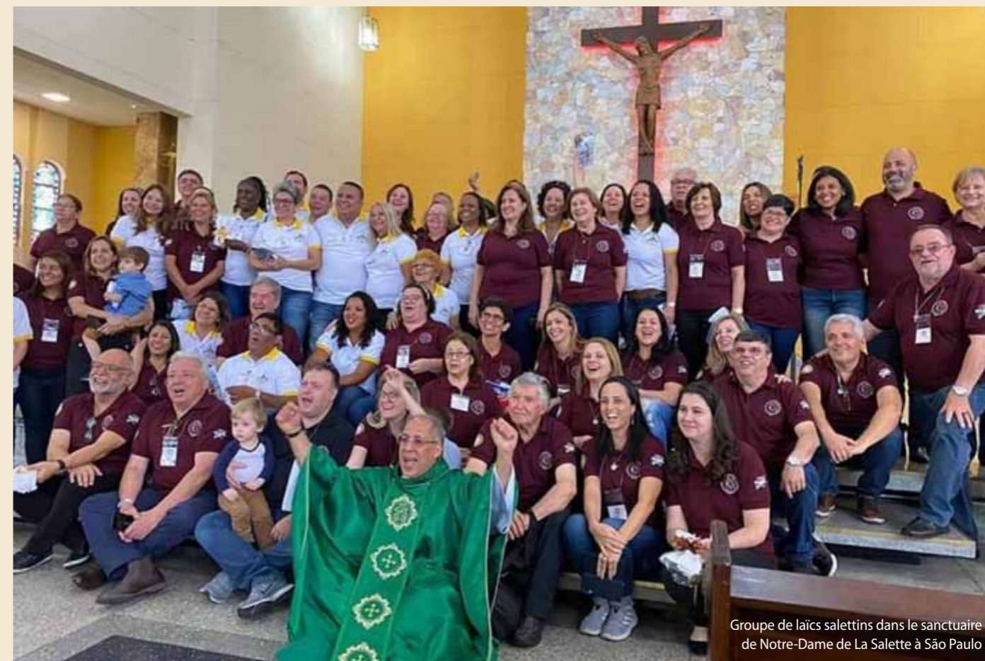
Groupe de laïcs salettins dans le sanctuaire de Notre-Dame de La Salette à São Paulo

Aujourd'hui, les laïcs salettins au Brésil forment quinze groupes dans les États suivants : Rio Grande do Sul, Parana, São Paulo, Rio de Janeiro, Minas Gerais, Mato Grosso i Bahia. Près de trois-cent-cinquante laïcs salettins travaillent dans des paroisses et communautés animées par des missionnaires de La Salette.