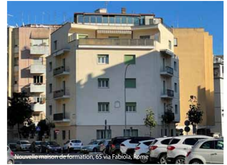
Nouvelle maison de formation, 65 via Fabiola, Rome

Ce projet est né grâce à la générosité des deux Provinces. Une collaboration très étroite entre elle existe depuis des années, et cette nouvelle réalité marque un pas de plus. D'un côté, l'Italie ouvre ses portes et contribue financièrement à la formation de jeunes étudiants africains, et de l'autre, l'Angola envoie certains de ses religieux pour travailler en Italie. Nous pouvons dire avec certitude que c'est le début d'un jumelage qui portera de bons fruits dans un avenir proche. Nous formons une famille, la fa-