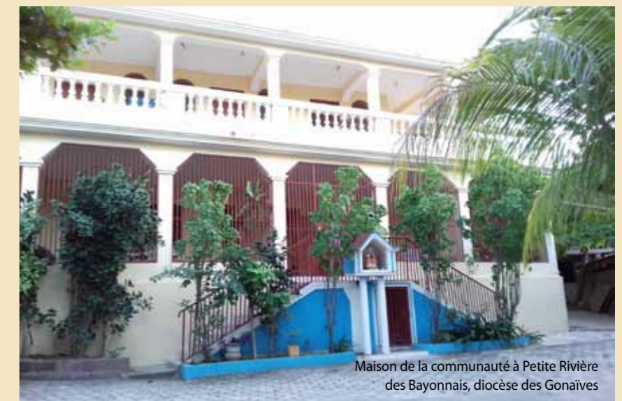
Maison de la communauté à Petite Rivière des Bayonnais, diocèse des Gonaïves