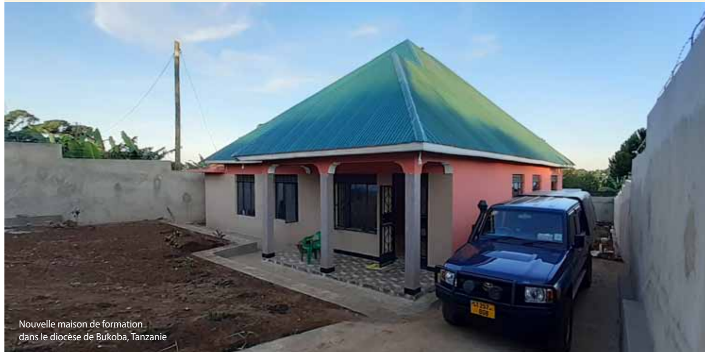
Nouvelle maison de formation dans le diocèse de Bukoba, Tanzanie

lette, pour son message et pour la Congrégation. De nombreux consacrés – prêtres et religieuses – nous ont suggéré de commencer à recruter et à former des jeunes, d'autant qu'actuellement dans le diocèse il n'y a que deux instituts masculins. Nous n'avons mené aucune campagne ni action pour promouvoir des vocations pour notre Congrégation. Pourtant, des questions formulées par de jeunes hommes nous sont parvenues de tout le pays par mail, par les réseaux sociaux et par des personnes que nous connaissions. Ce qui a incité la communauté de Tanzanie à proposer officiellement à la Congrégation d'ouvrir la formation. Nous savons tous que certaines motivations de candidats sont entachées par des motifs douteux, mais ce n'est pas une raison pour rester immobiles et ne pas penser à élargir notre communauté.