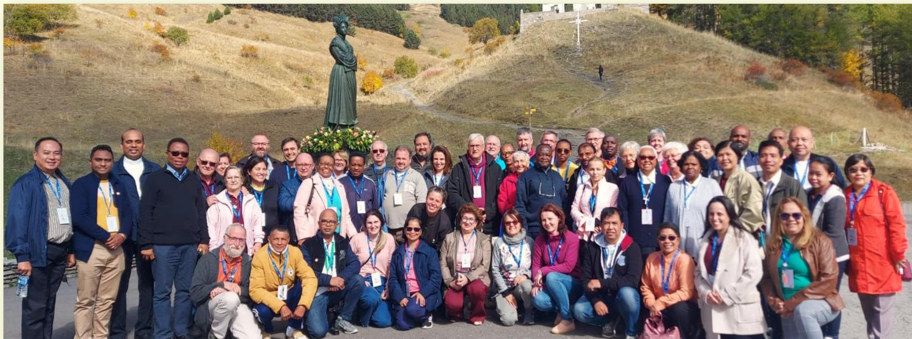
Delegacja uczestnicząca w Trzecim Międzynarodowym Spotkaniu Świeckich La Salette

Maximin i Melanie byli wierni za życia. Bądźmy także wierni naszym jawnym celom, które wyznaczono na Górze La Salette w 2011 r. podczas I. Międzynarodowe Spotkanie Świeckich La Salette.